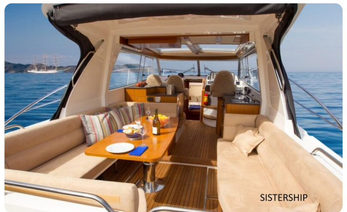
Saga 390 HT Sistership 2.jpg