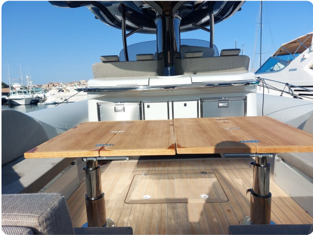
sacs strider 15-9