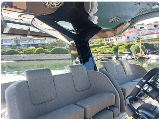
sacs strider 15-13