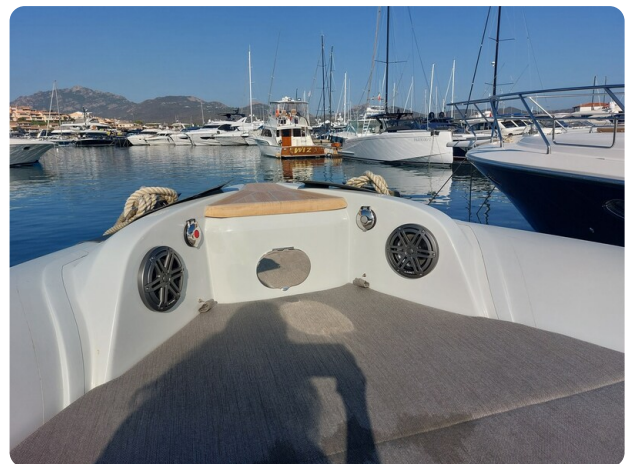
sacs strider 15-17