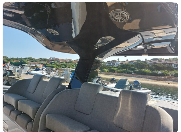
sacs strider 15-14