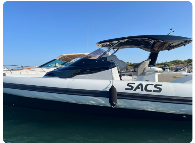
sacs strider 15-36