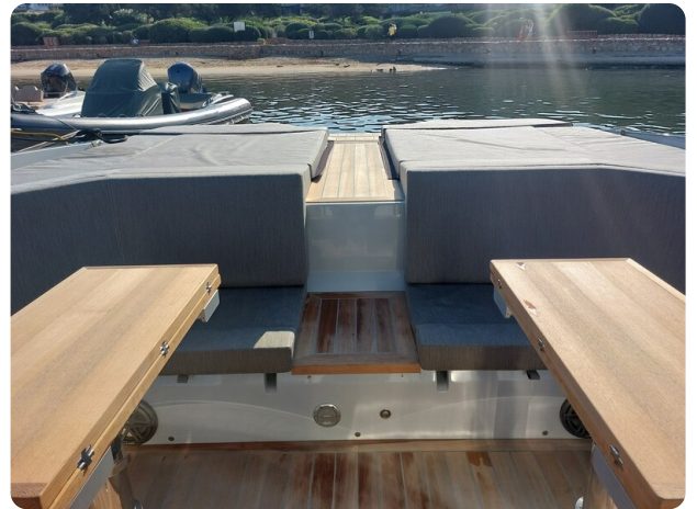
sacs strider 15-8