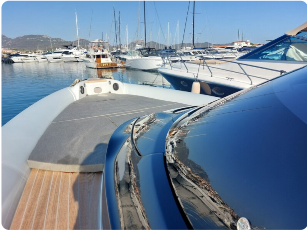
sacs strider 15-18