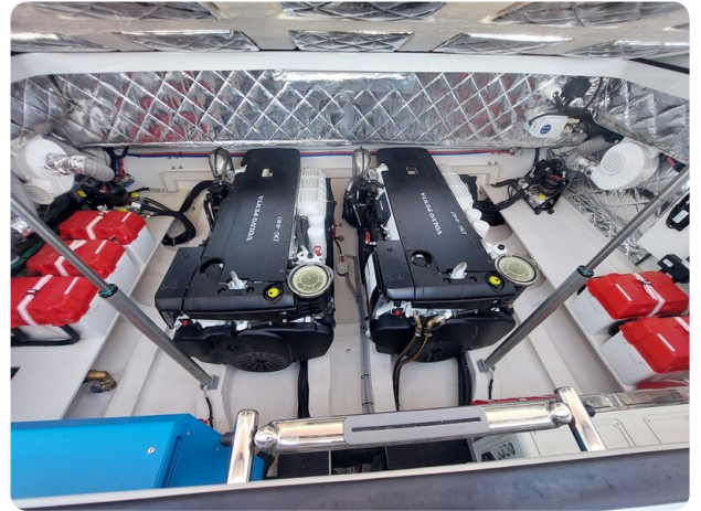
sacs strider 15-25