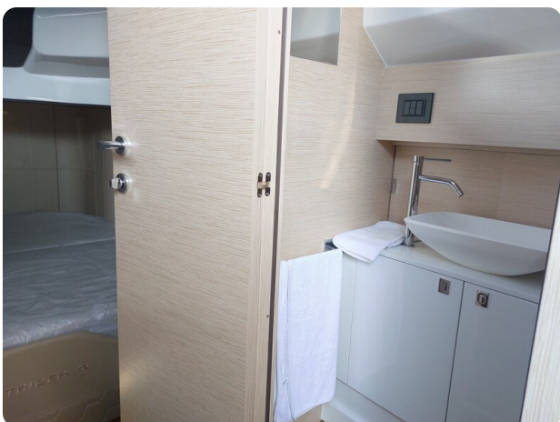
sacs strider 15-50