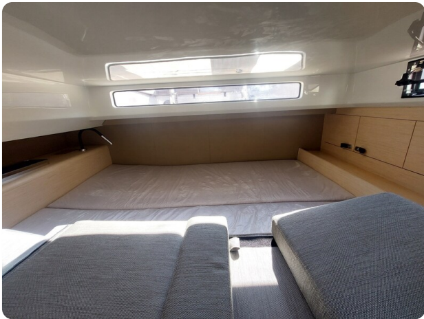
sacs strider 15-54