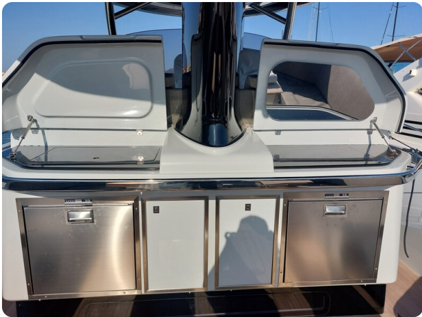
sacs strider 15-7