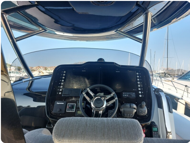
sacs strider 15-22