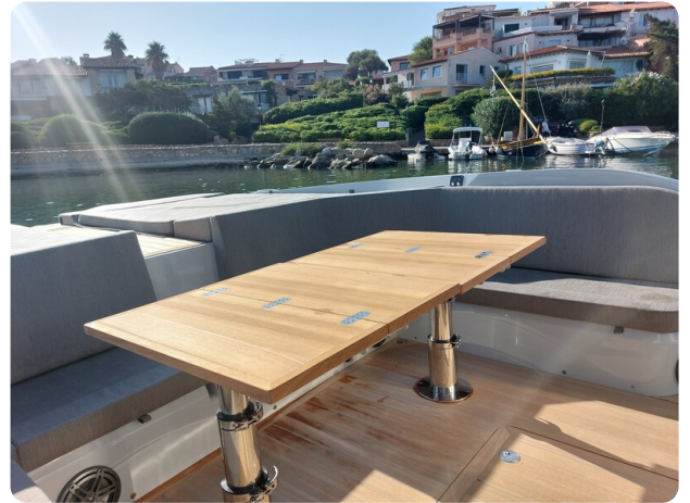
sacs strider 15-10