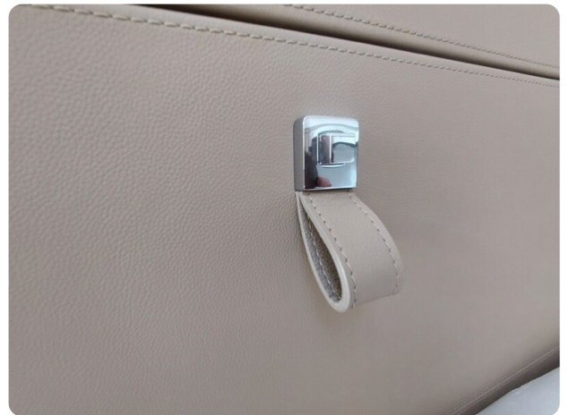
sacs strider 15-57