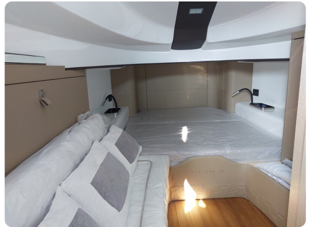
sacs strider 15-49