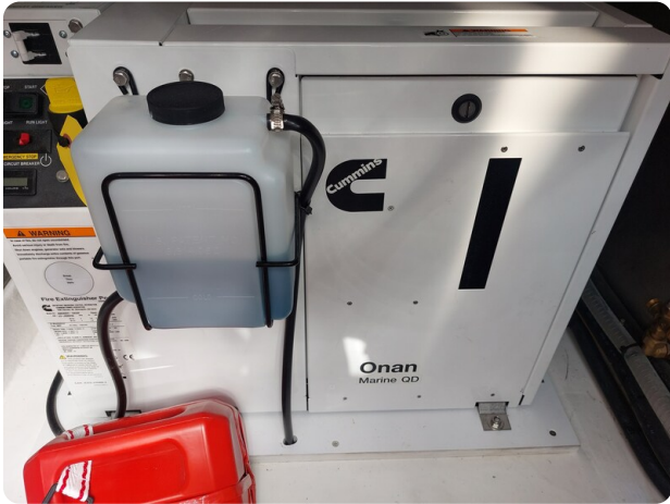
sacs strider 15-24