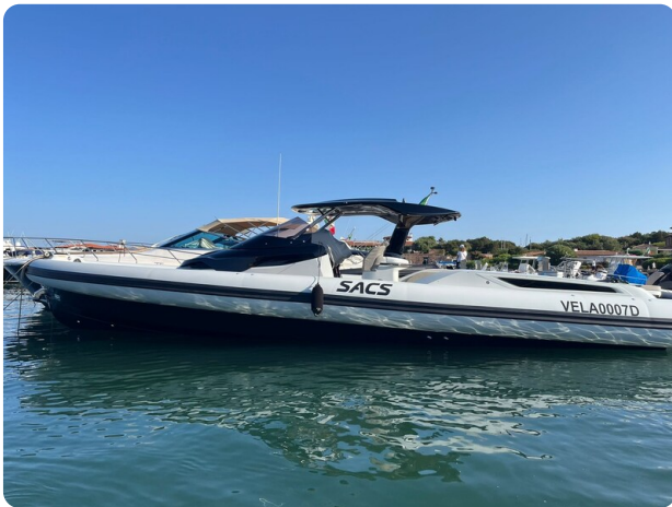
sacs strider 15-45