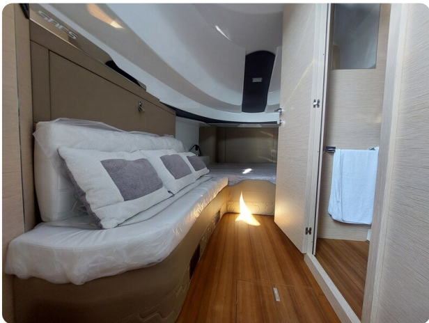
sacs strider 15-56