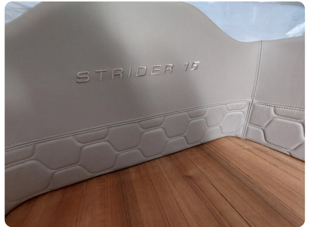
sacs strider 15-55