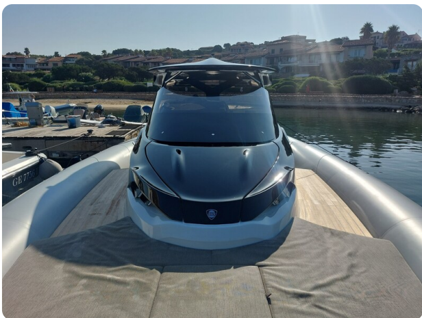
sacs strider 15-20