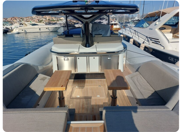
sacs strider 15-5