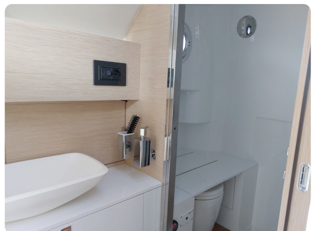
sacs strider 15-51