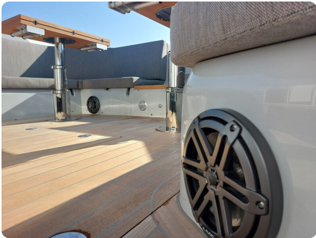
sacs strider 15-11