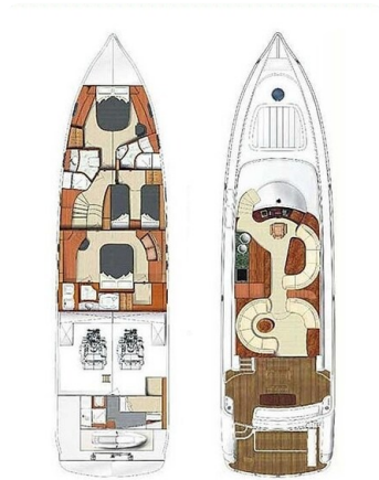
Rodman 64, Belisa, layout