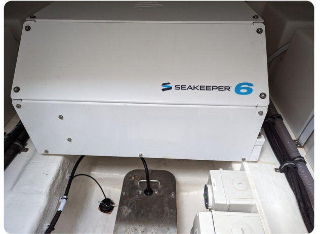
Riviera 45 Fly Seakeeper