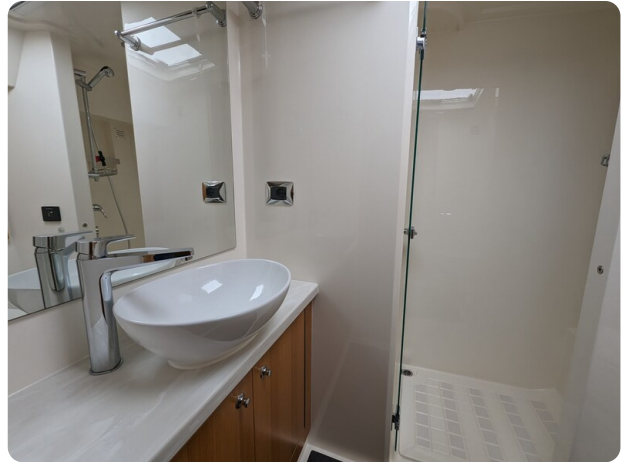
Riviera 45 Fly owner's bathroom