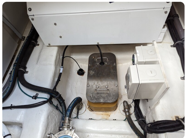
Riviera 45 Fly echo transducer