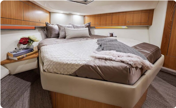
Riviera 45 Open Flybridge owner's cabin