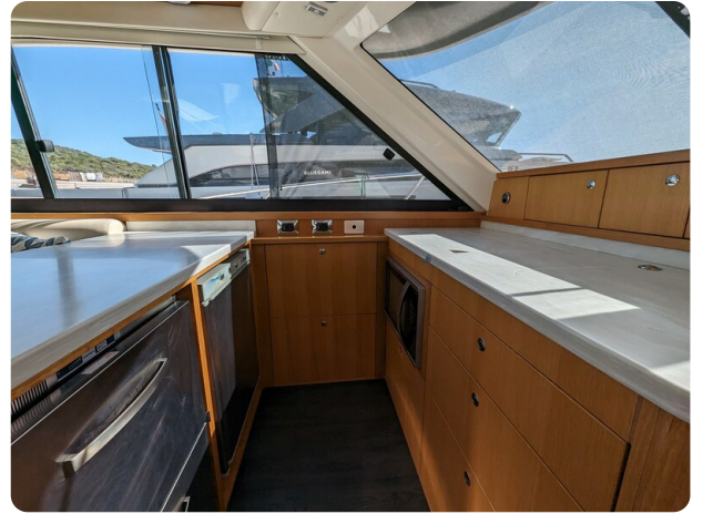
Riviera 45 Fly galley