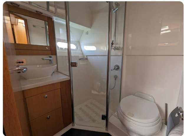
Riviera 45 Fly guest bathroom