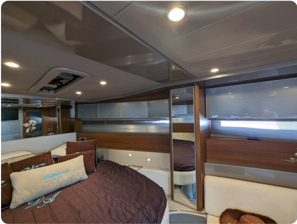
Rivarama interior details