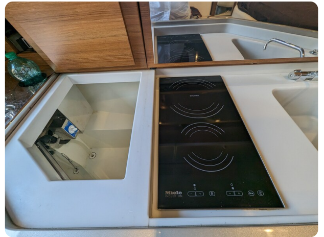
Rivarama galley detail