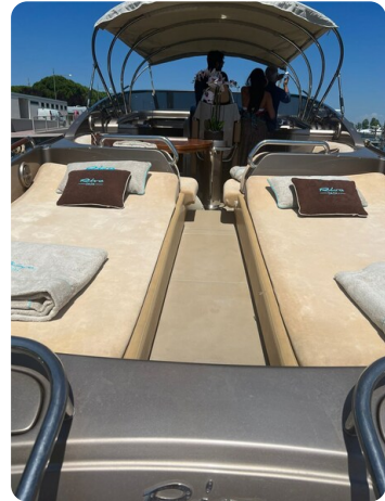
Rivarama aft sunpad