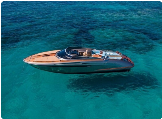
Rivarama Aerial 3