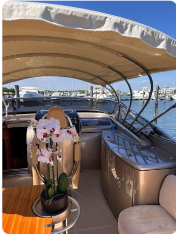
Rivarama cockpit detail