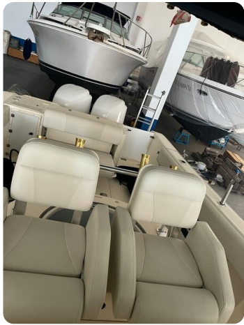
Pursuit C310 cockpit detail