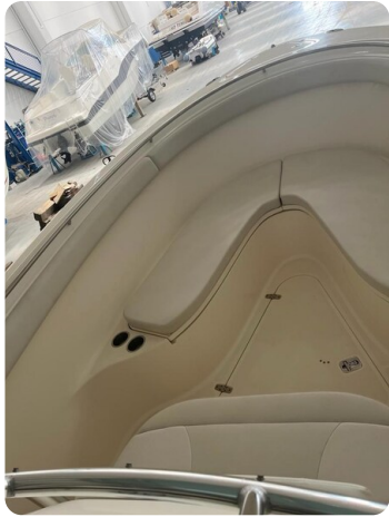
Pursuit C310 bow cockpit