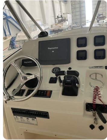
Pursuit C310 helm