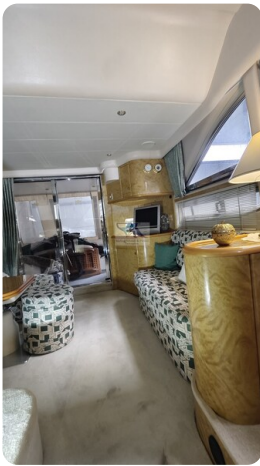
Princess 420 ARNO 13