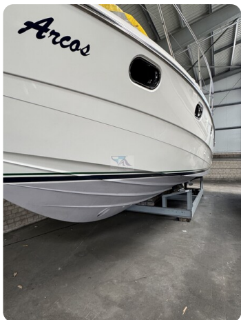
Princess 420 ARCOS 48