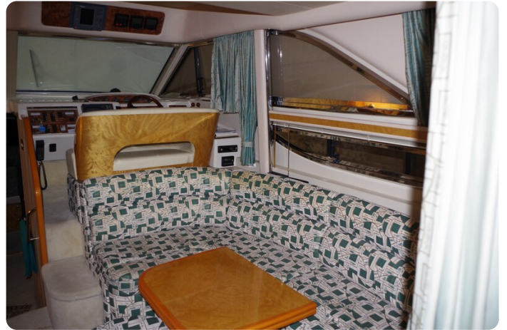
Princess 420 39