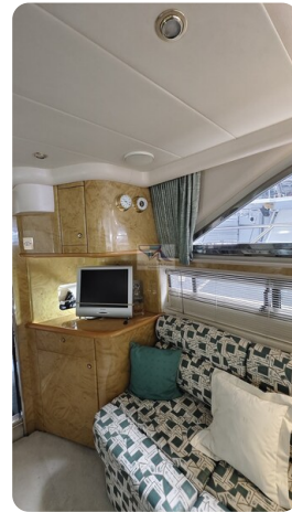
Princess 420 ARNO 5