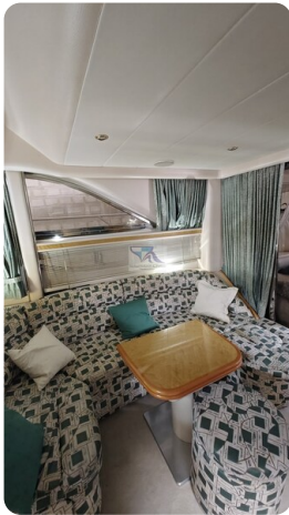
Princess 420 ARNO 4