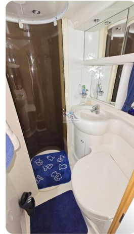
Princess 420 ARNO 18