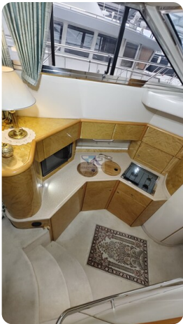
Princess 420 ARNO 11