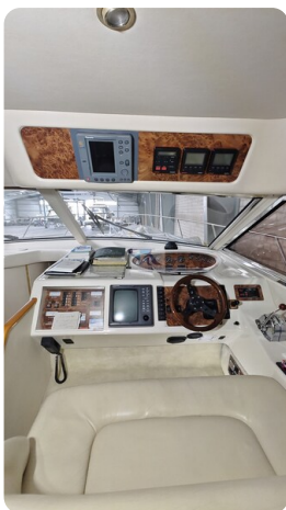
Princess 420 ARNO 6