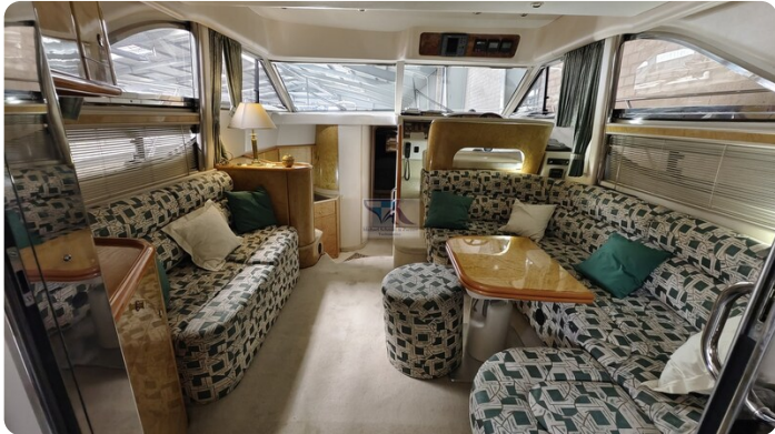
Princess 420 ARNO 1