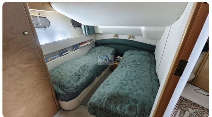
Princess 420 ARNO 45