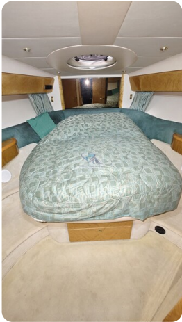
Princess 420 ARNO 15