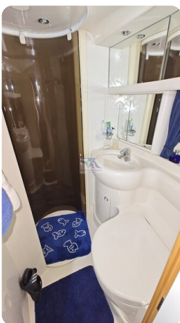
Princess 420 ARNO 18