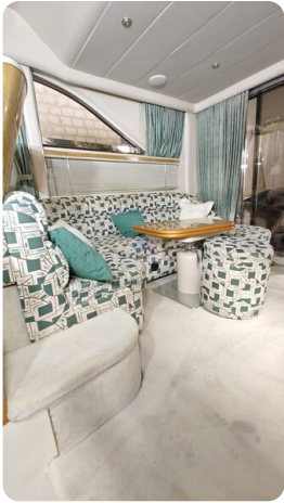
Princess 420 ARNO 28