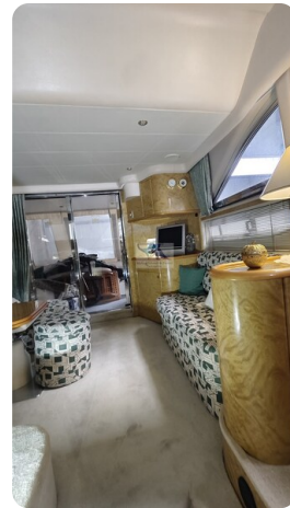
Princess 420 ARNO 13