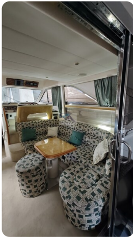
Princess 420 ARNO 3