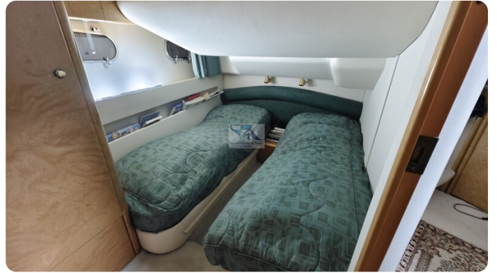
Princess 420 ARNO 45