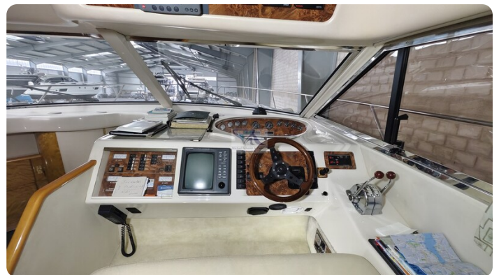
Princess 420 ARNO 8