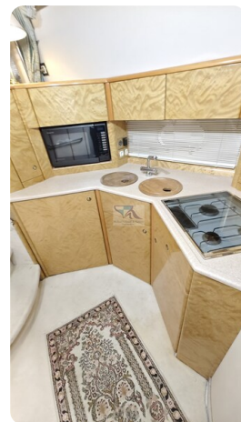
Princess 420 ARNO 25