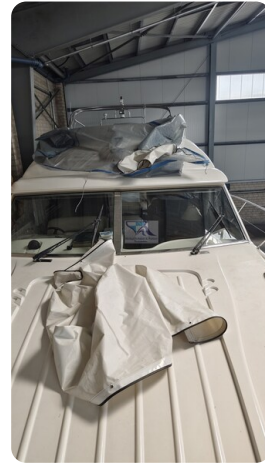
Princess 420 ARNO 49