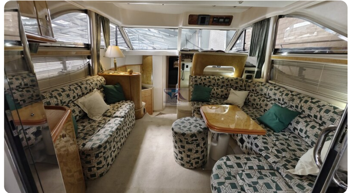
Princess 420 ARNO 1