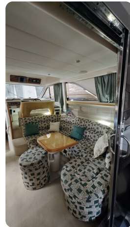
Princess 420 ARNO 3