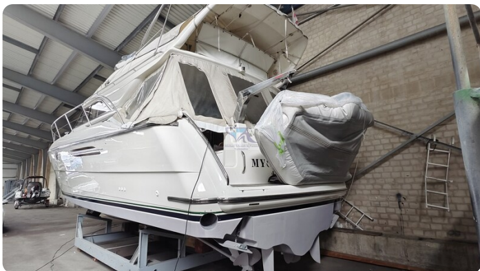
Princess 420 ARNO 35