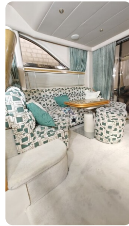
Princess 420 ARNO 28