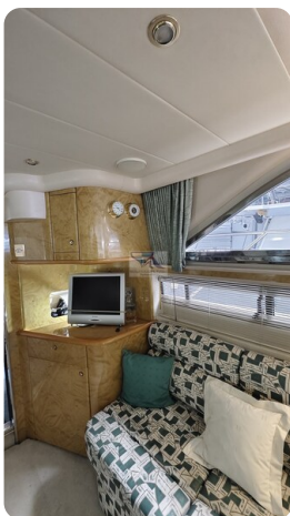
Princess 420 ARNO 5