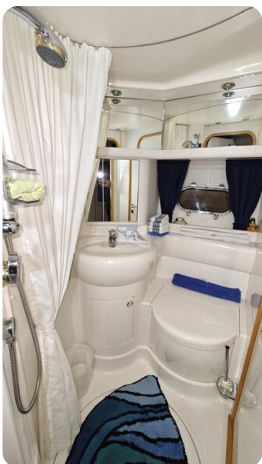
Princess 420 ARNO 20