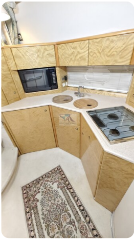
Princess 420 ARNO 25