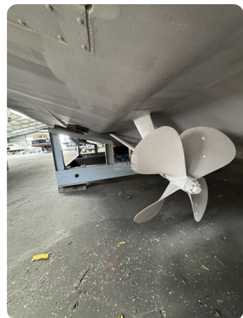
Princess 420 ARCOS 45