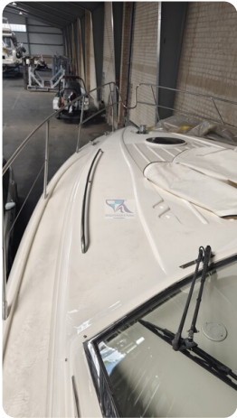
Princess 420 ARNO 47