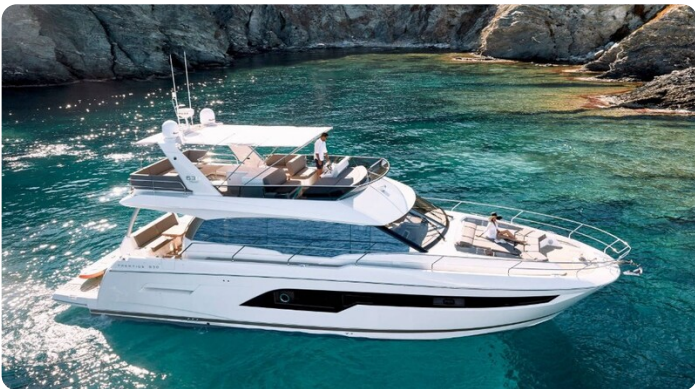
Prestige 630 Sistership