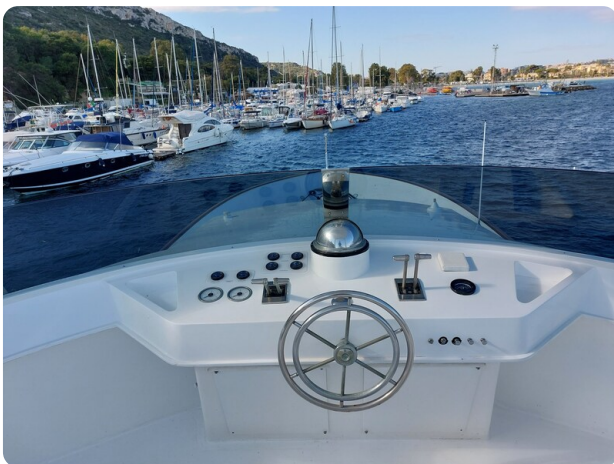
Picchiotti 68, Cabanon, flybridge postazione di guida