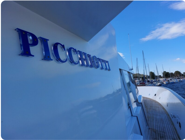
Picchiotti 68, Cabanon dettaglio