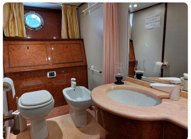
Picchiotti 68, Cabanon, wc cabina ospiti 2