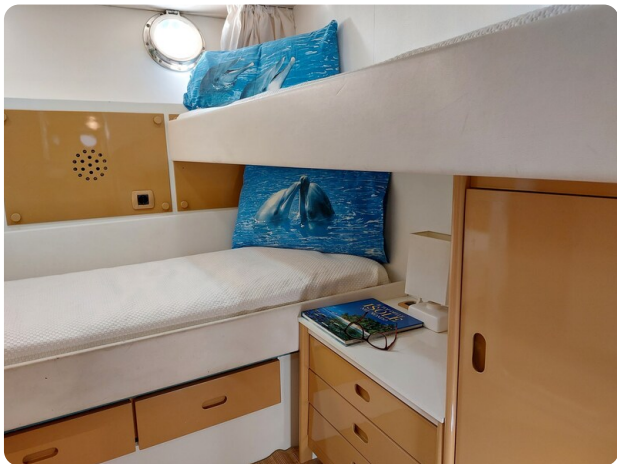
Picchiotti 68, Cabanon, cabina ospiti 1