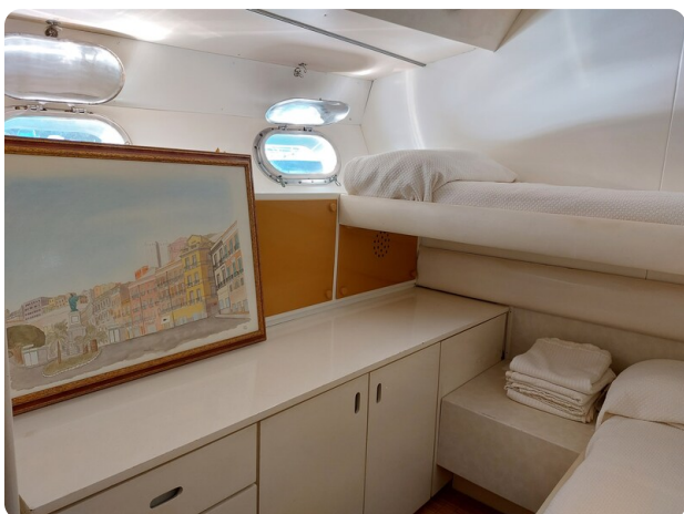
Picchiotti 68, Cabanon, cabina ospiti 3