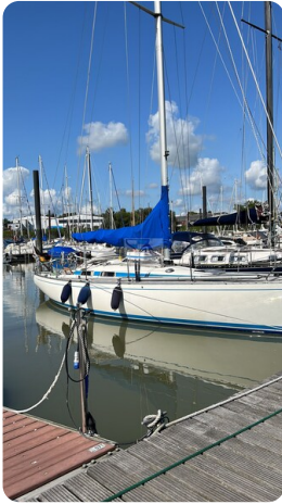
Avance 36 dL msp1