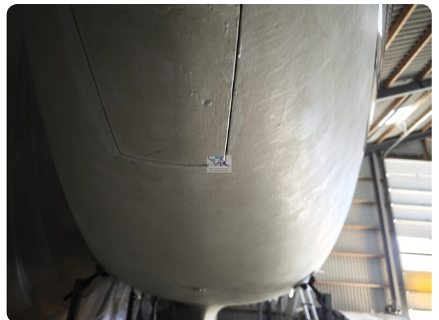
Nordborg 40 4