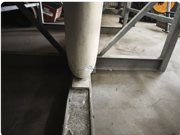
Nordborg 40 5