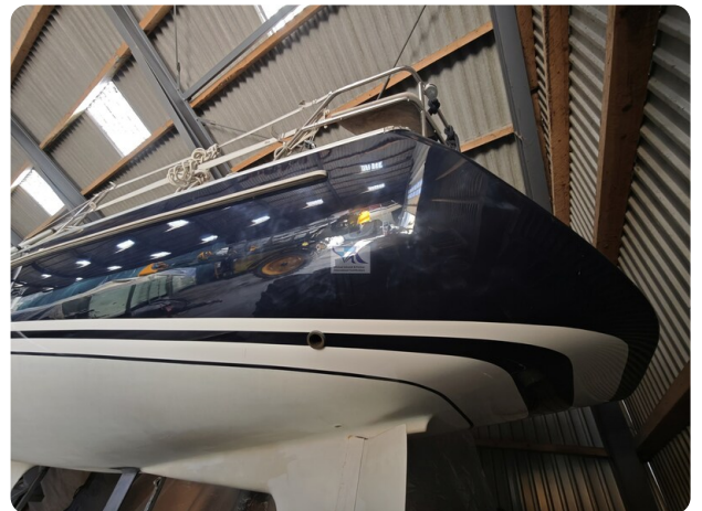
Nordborg 40 11