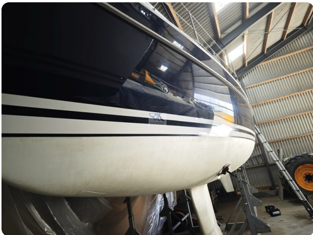
Nordborg 40 2