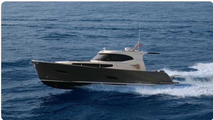
Monachus 45 SC 1