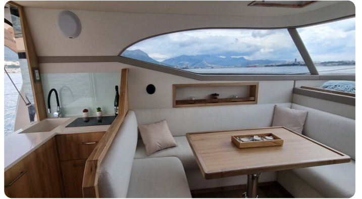
Monachus 45 SC 9