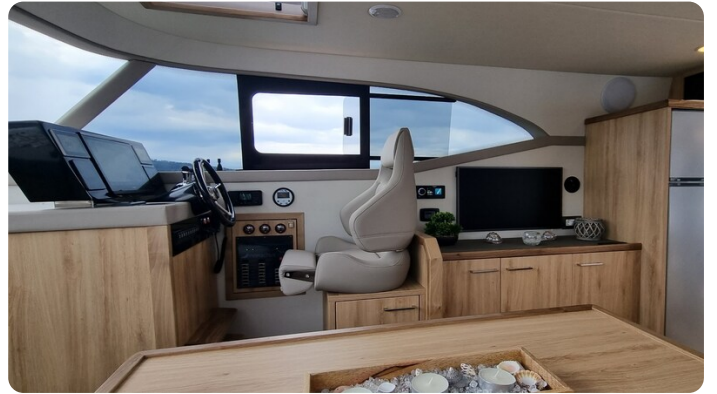
Monachus 45 SC 11