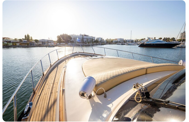
Dolphin 51 bow deck