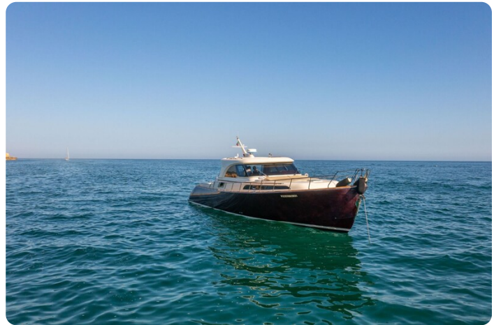
Dolphin 51 bow view