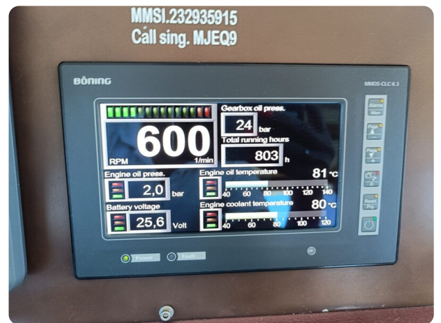
Dolphin 51 engine hours 29-08-24