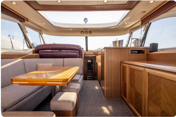
Dolphin 51 salon