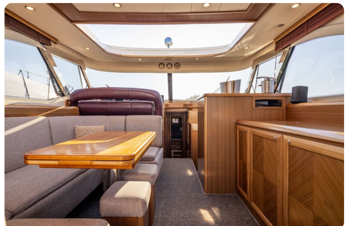
Dolphin 51 salon