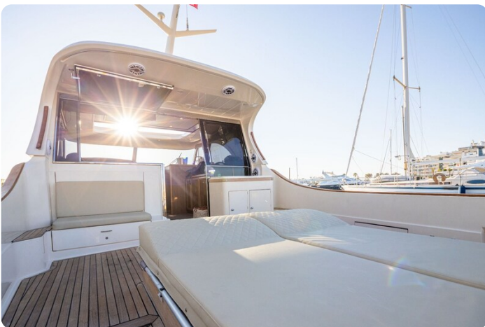
Dolphin 51 cockpit detail