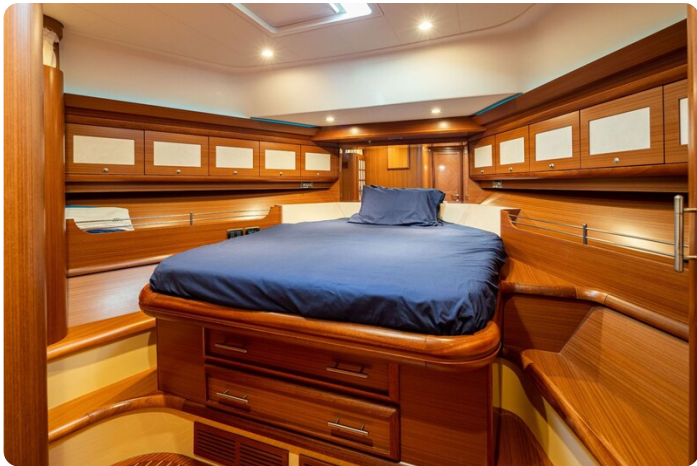
Dolphin 51 Vip cabin