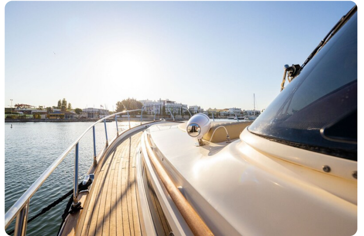
Dolphin 51 sideways