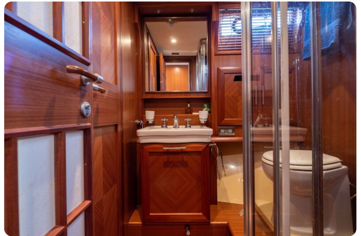
Dolphin 51 bathroom