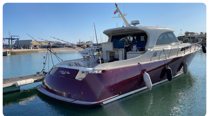
Dolphin 51 aft profile