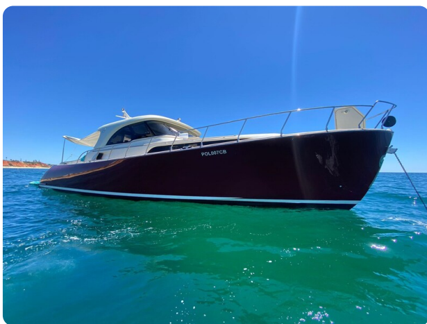
Dolphin 51 bow profile