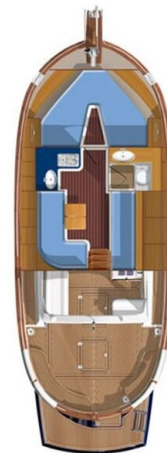
Menorquin 55T layout