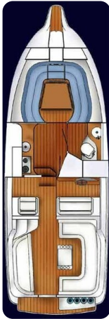
Marex 290 Sun Cruiser_Layout