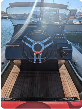
Lomac Adrenalina 7.5