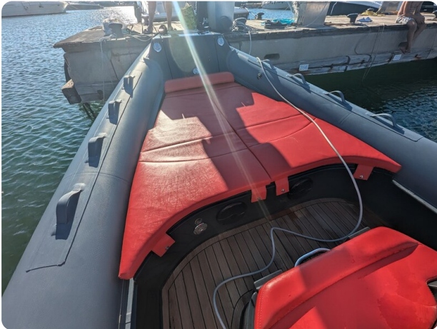
Lomac Adrenalina 7.5 bow sunpad