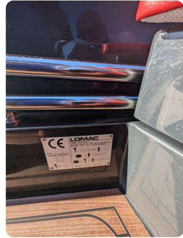
Lomac Adrenalina 7.5 CE plate