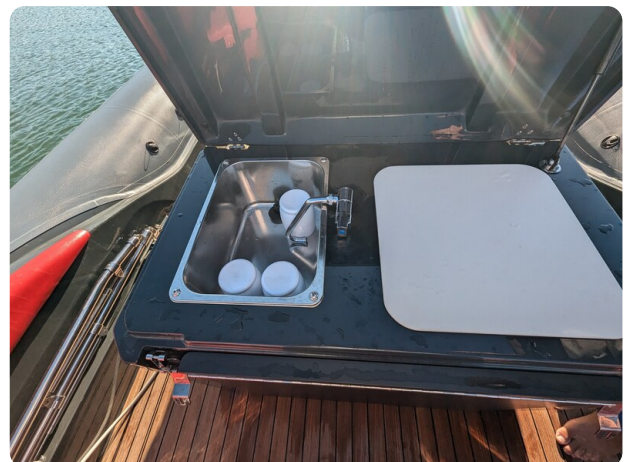
Lomac Adrenalina 7.5 sink