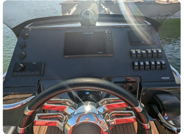
Lomac Adrenalina 7.5 helm detail