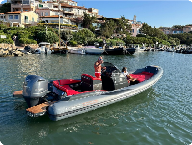
Lomac 7.50 Adrenalina aft view