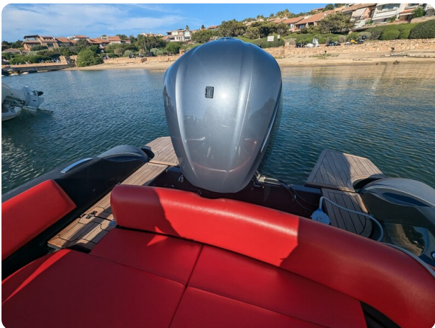
Lomac Adrenalina 7.5 stern view