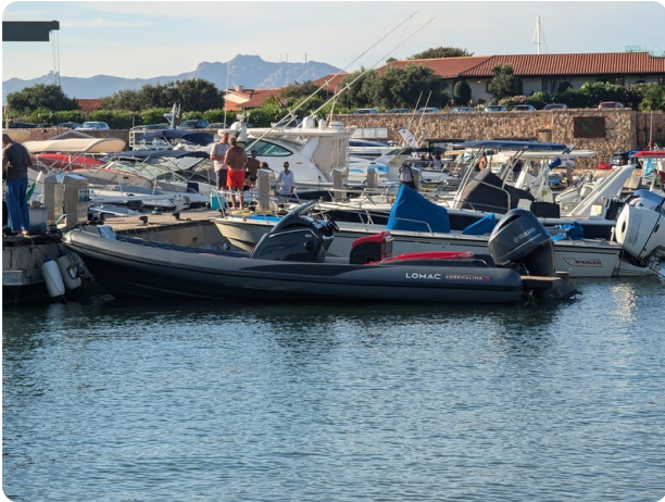
Lomac Adrenalina 7.5 view