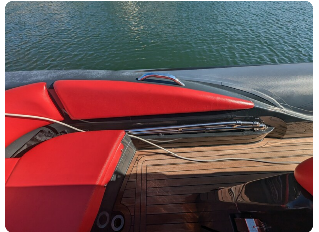
Lomac Adrenalina 7.5 detail