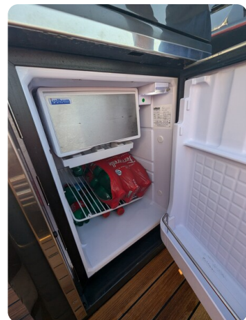
Lomac Adrenalina 7.5 fridge