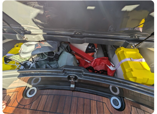
Lomac Adrenalina 7.5 storage