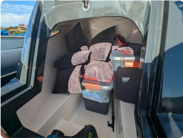
Lomac Adrenalina 7.5 storage console