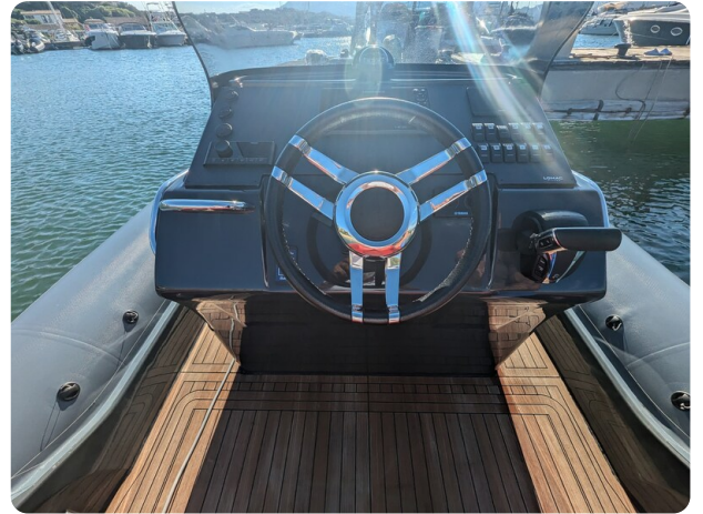
Lomac Adrenalina 7.5 helm