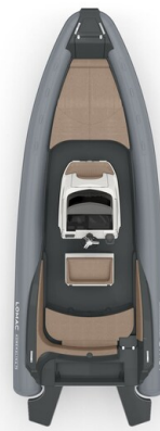
Lomac Adrenalina 7.5 layout