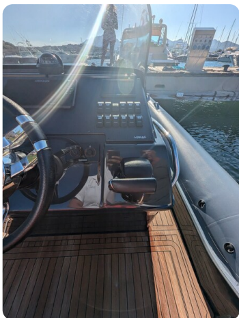
Lomac Adrenalina 7.5 console