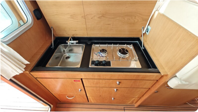
Linsse Grand Sturdy 29.9 16