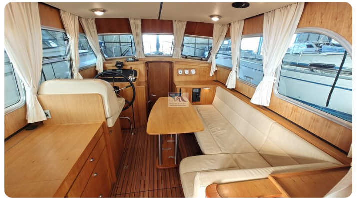
Linssen Grand Sturdy 29.9 19