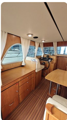
Linssen Grand Sturdy 29.9 21