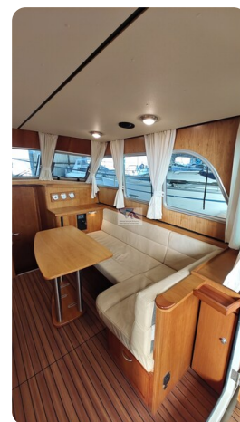
Linssen Grand Sturdy 29.9 22