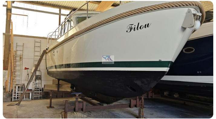
Linssen Grand Sturdy 29.9 83