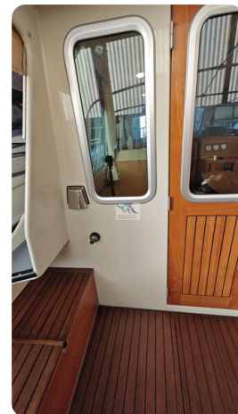
Linssen Grand Sturdy 29.9 56