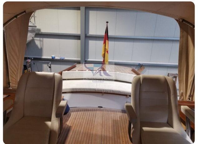
Kiel Legend 28 12