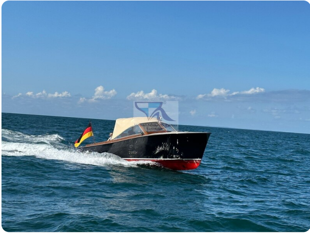
Kiel Legend 28 1