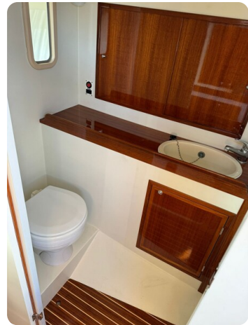
Kiel Legend 28 48