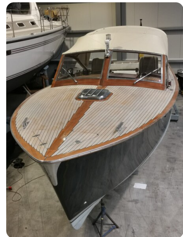
WhatsApp Bild 2025-09-05 um 09.49.47_9d1f9ad8