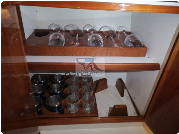
Kiel Legend 28 29