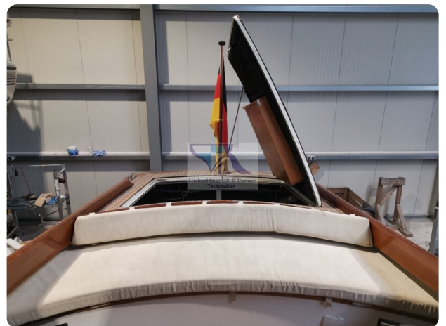
Kiel Legend 28 28