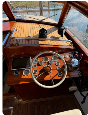
Kiel Legend 28 50