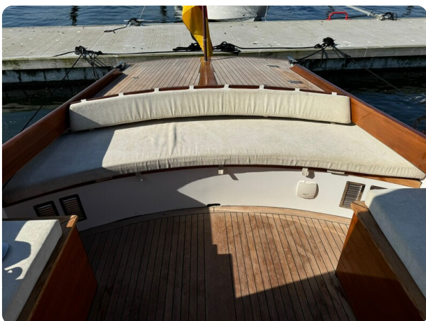
Kiel Legend 28 51