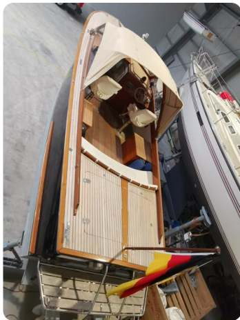
WhatsApp Bild 2025-09-05 um 09.49.46_aef3b8aa