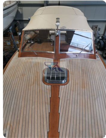
Kiel Legend 28 16