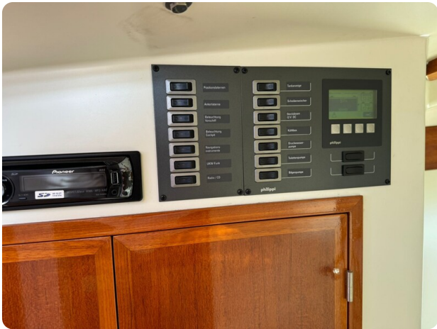
Kiel Legend 28 46