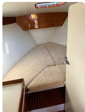
Kiel Legend 28 47