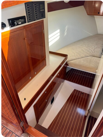
Kiel Legend 28 49