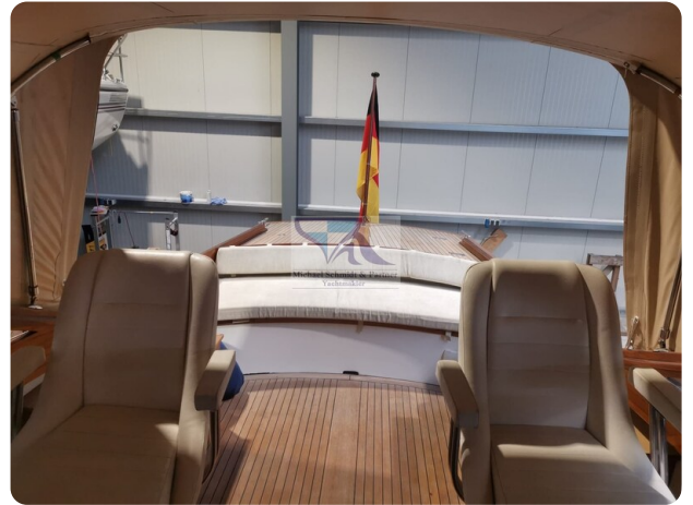
Kiel Legend 28 12