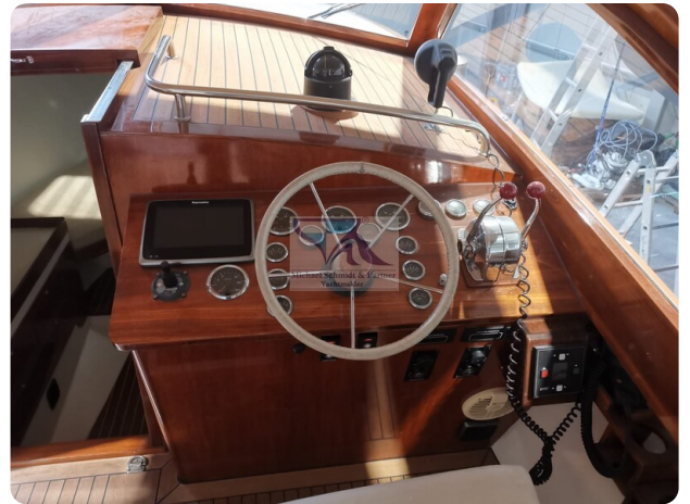
Kiel Legend 28 10