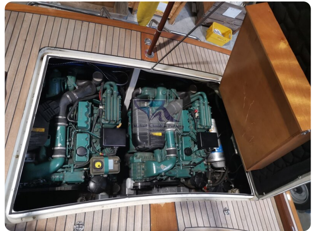
Kiel Legend 28 30