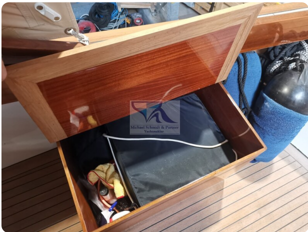
Kiel Legend 28 32