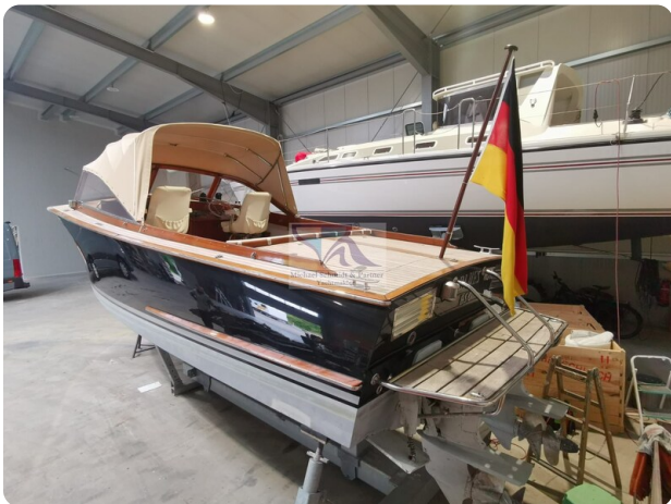
Kiel Legend 28 6