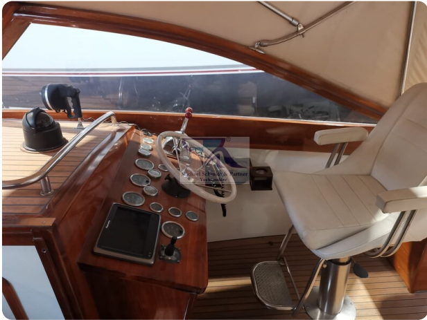
Kiel Legend 28 15