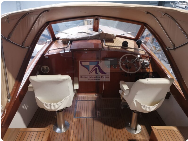
Kiel Legend 28 45