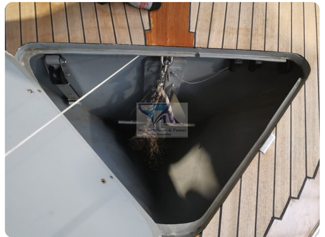
Kiel Legend 28 11