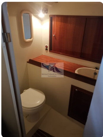
Kiel Legend 28 21