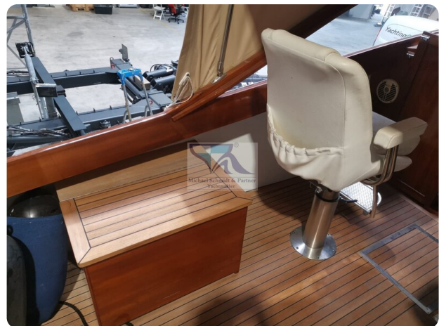
Kiel Legend 28 38