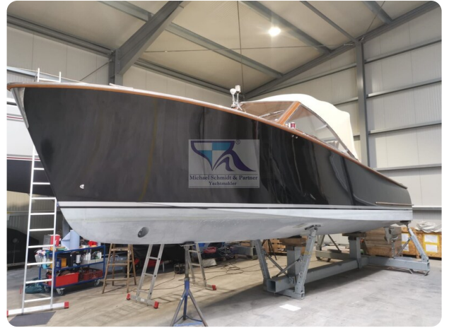
Kiel Legend 28 40