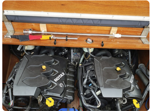
Kaiser 650 Super Sport 23