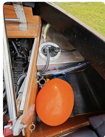
Kaiser 650 Super Sport 12