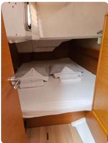
Jeanneau Sun Odyssey 389 ZIVJELLI 12