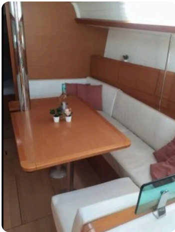
Jeanneau Sun Odyssey 389 ZIVJELLI 8