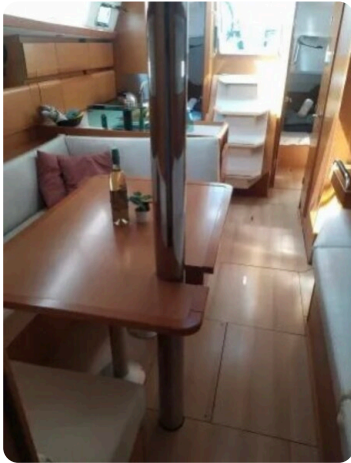
Jeanneau Sun Odyssey 389 ZIVJELLI 9