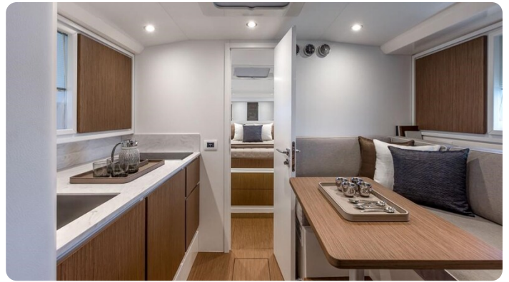
Itama 45RS interiors