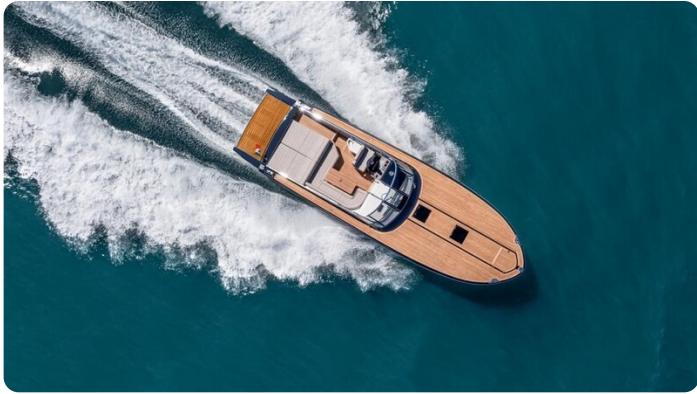
Itama 45RS cruising