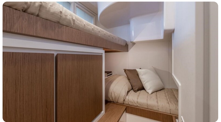
Itama 45RS guest cabin