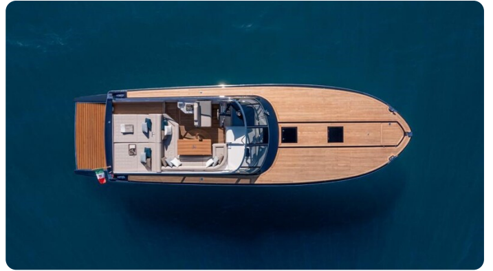
Itama 45RS aerial