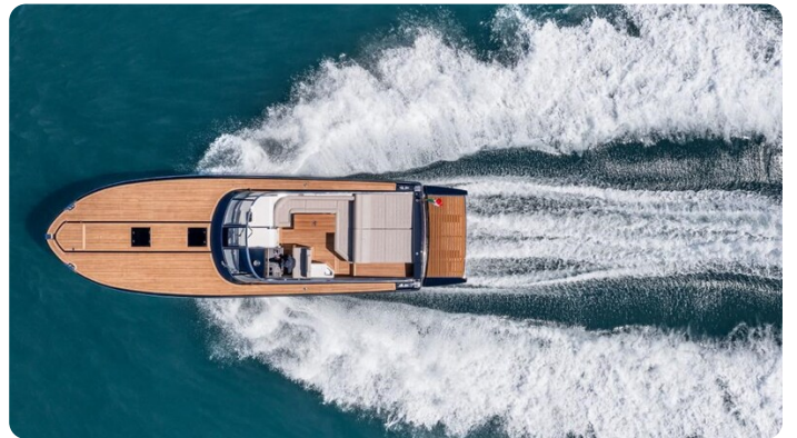
Itama 45RS running