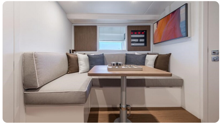
Itama 45RS salon detail