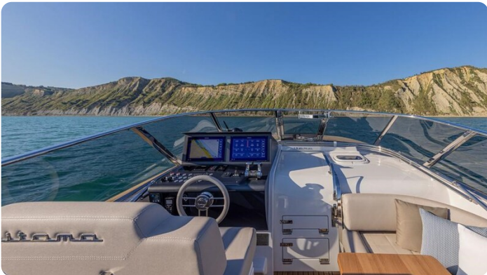
Itama 45RS helm station