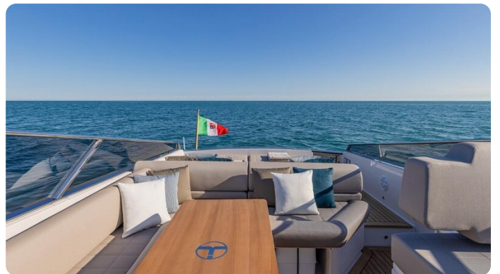
Itama 45RS cockpit dinette