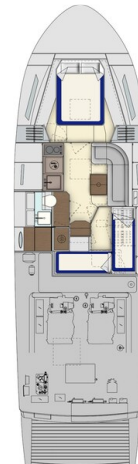
Itama 45RS lower layout