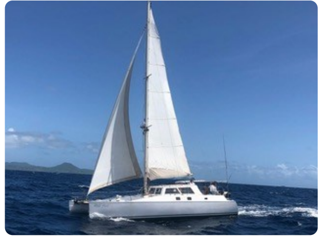
21 Gross und Genua