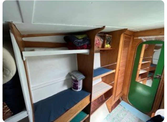
63 Koje Gäste