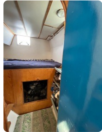
65 Koje Gäste achtern