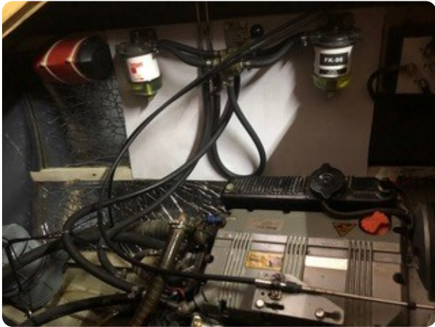
85 Motorraum Dieselfilter