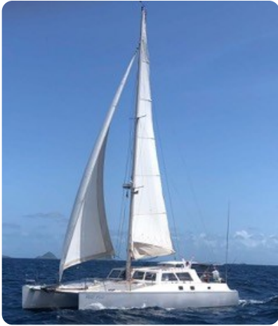
20 Gross und Genua