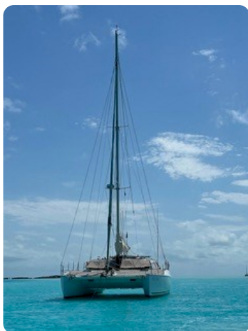
17 von vorne