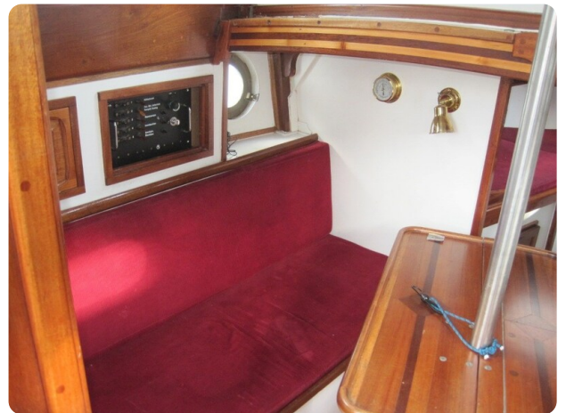
Salon BB Seite