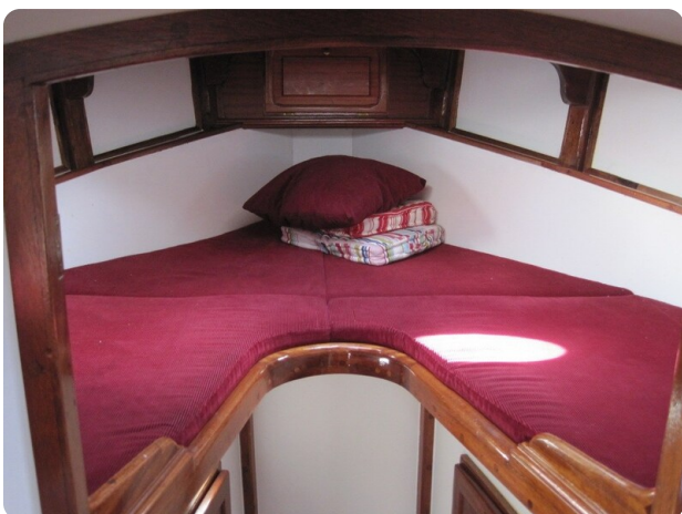
V-Koje 65 Pro