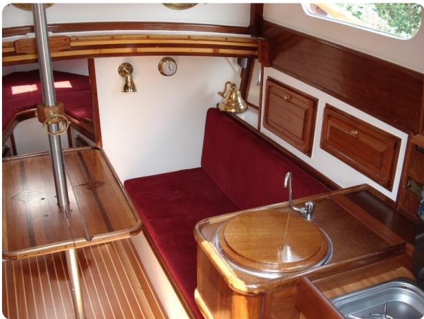
Salon BB 70 proz