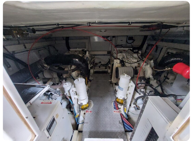
Hatteras 39 Express engine room