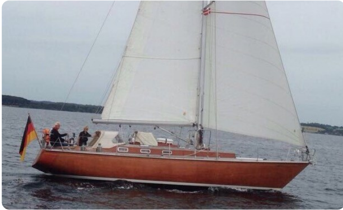
Hatecke 42 MELLUM