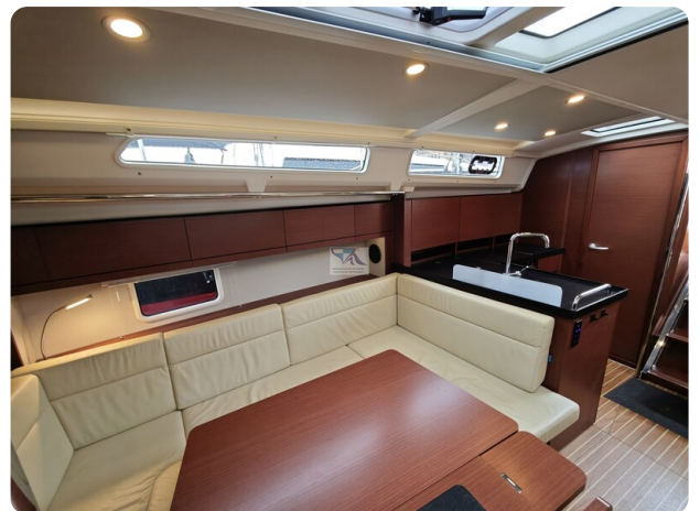
Hanse 418 EDGE 33