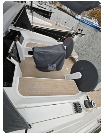
Hanse 418 EDGE 12