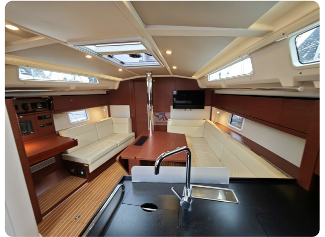
Hanse 418 EDGE 29