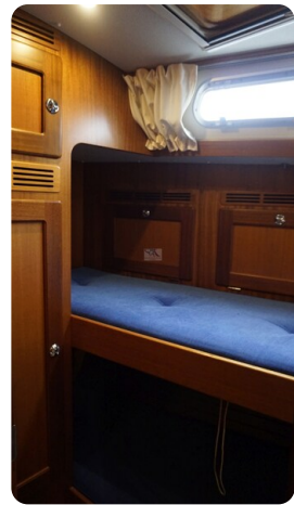
Hallberg Rassy 48 AURORA 42