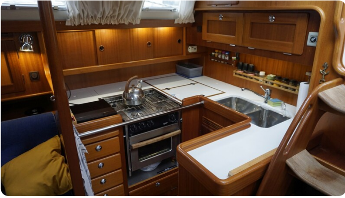
Hallberg Rassy 48 AURORA 23