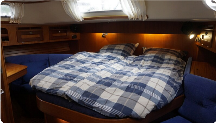
Hallberg Rassy 48 AURORA 31