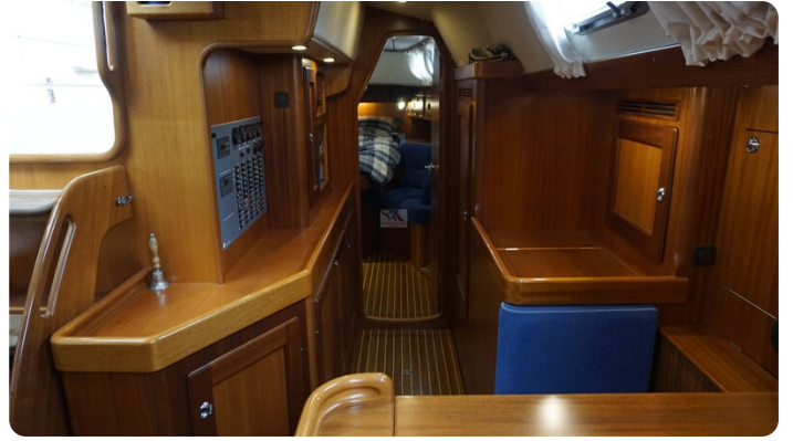
Hallberg Rassy 48 AURORA 28