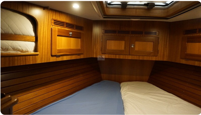
Hallberg Rassy 48 AURORA 39