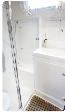
Hallberg Rassy 48 AURORA 34