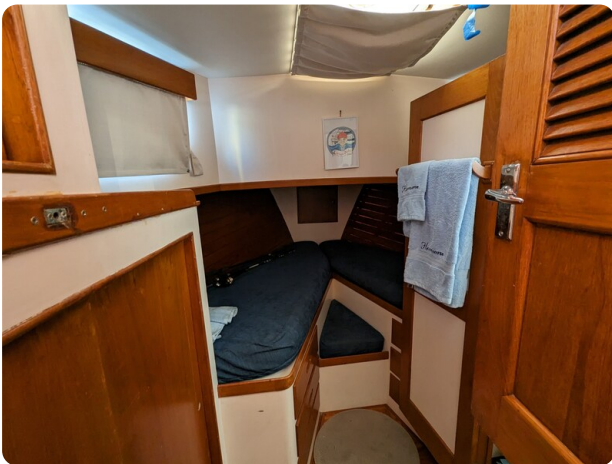
Grand Banks 42 Classic guest cabin