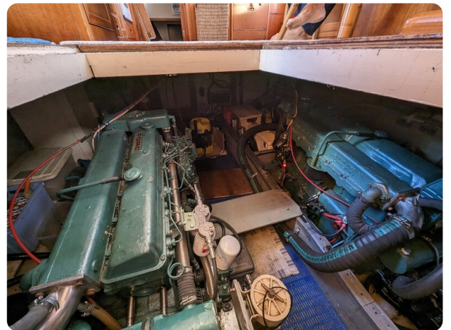
Grand Banks 42 Classic engine room