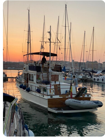
Grand Banks 42 sunset