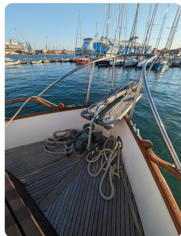
Grand Banks 42 Classic bow pulpit