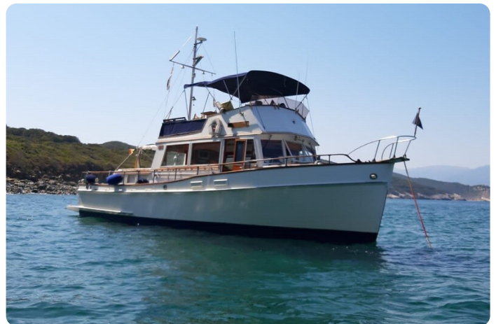
Grand Banks 42 Classic bow view