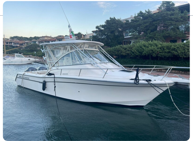
Grady White 305 express