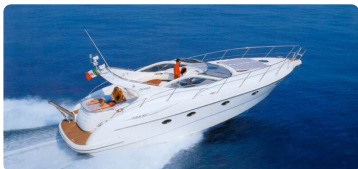
Gobbi sister ship