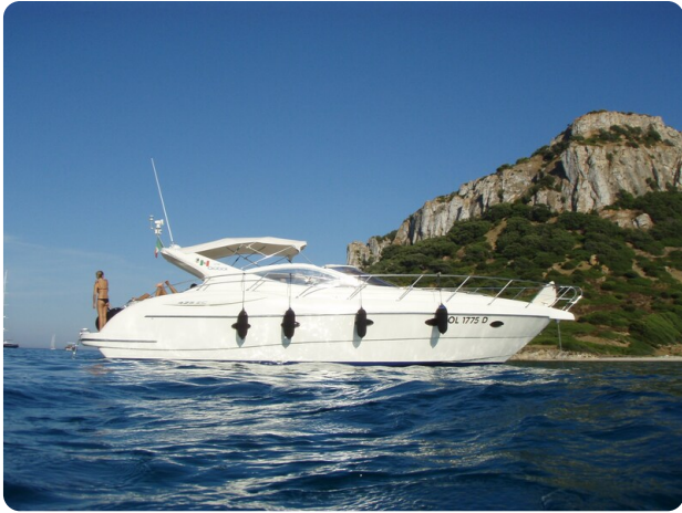
Gobbi 425 esterno (1)