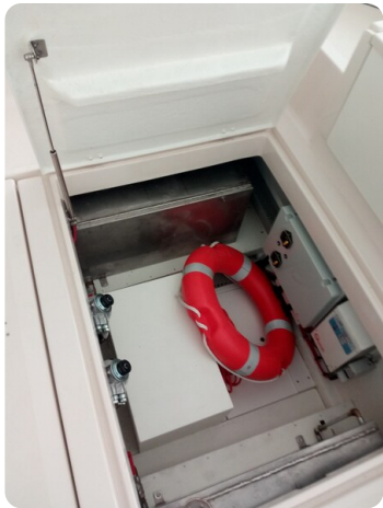
Nelson 24 storage