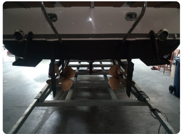
Nelson 24 Open props