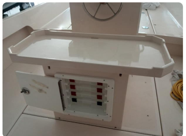
Nelson 24, cassetiera pesca