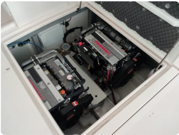
Nelson 24 Open engine room