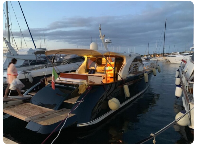
Franchini 55, sunset