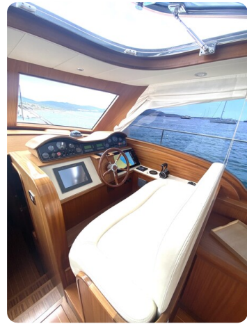
Franchini 55 Emozione