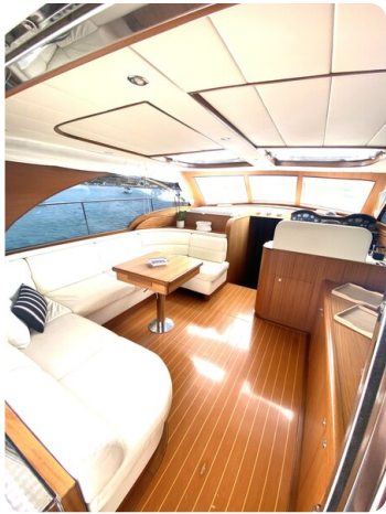
Franchini 55 Emozione