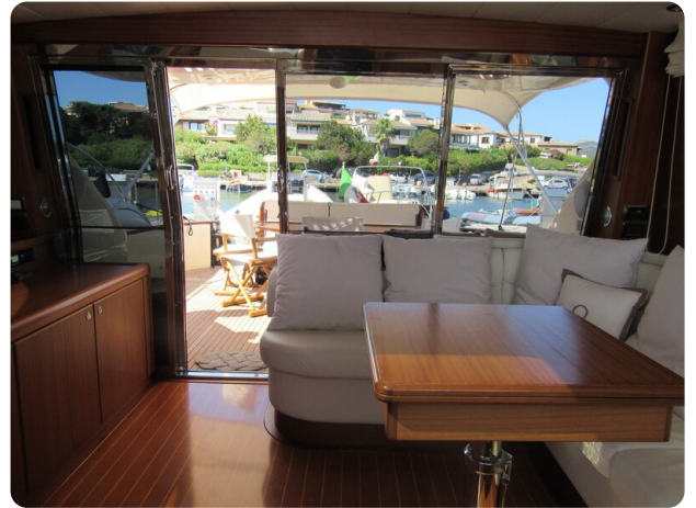
Franchini 55 Emozione, salon to aft