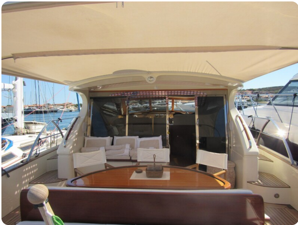
Franchini 55 Emozione, cockpit view to fwd