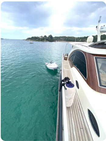
Franchini 55 Emozione