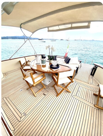
Franchini 55 Emozione