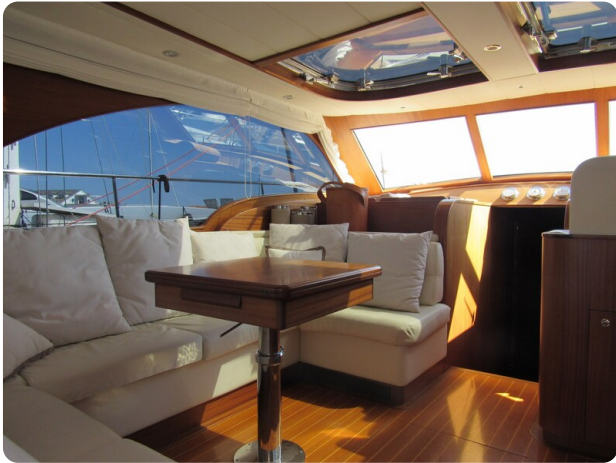
Franchini 55 Emozione, dinette