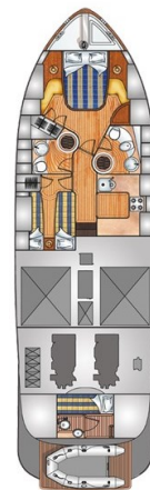
Franchini 55 lower layout