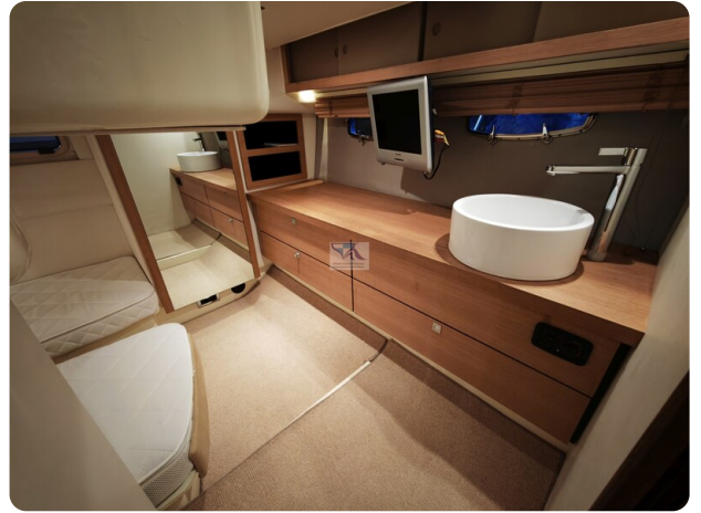
Fairline Targa 38 38