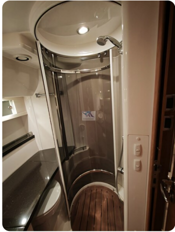
Fairline Targa 38 36