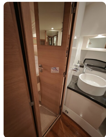
Fairline Targa 38 49