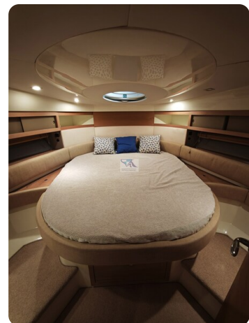
Fairline Targa 38 23