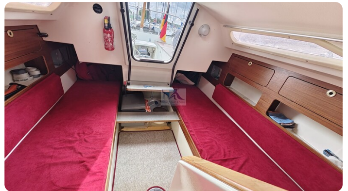
Etap 23i 13