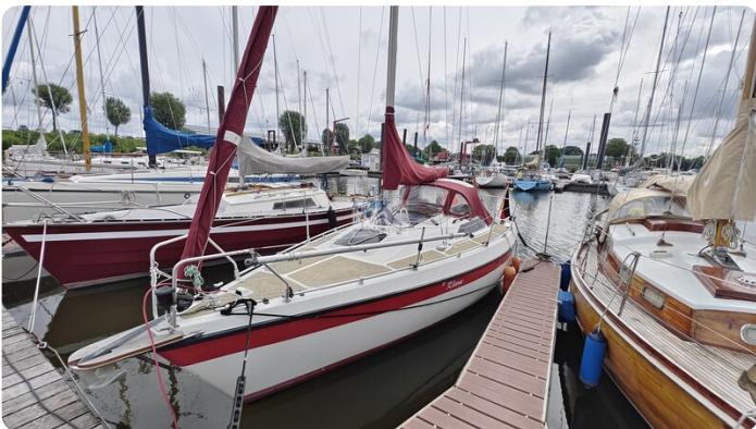
Etap 23i 20