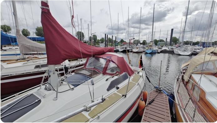
Etap 23i 23