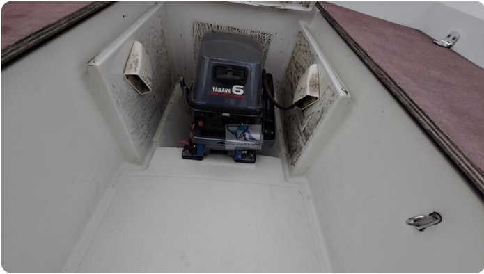
Etap 23i 27