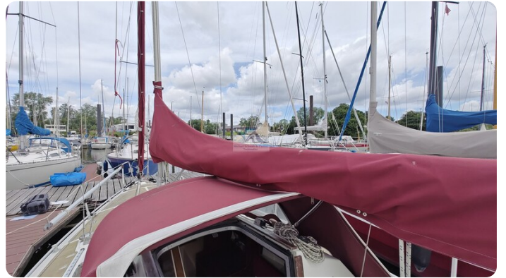
Etap 23i 29