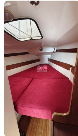
Etap 23i 1