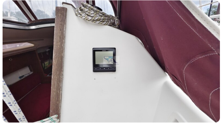
Etap 23i 28