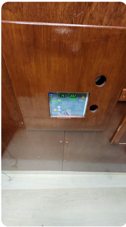
Reinke Tourina 10m_48