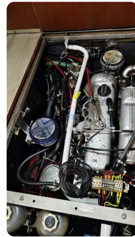
Reinke Tourina 10m_51