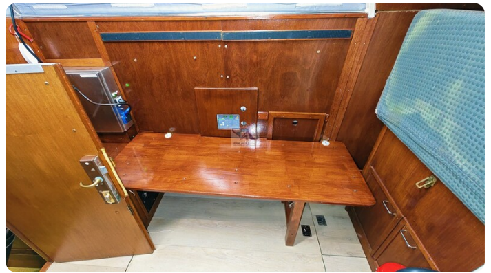
Reinke Tourina 10m_62