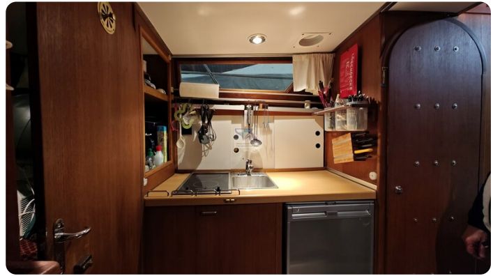
Reinke Tourina 10m_8