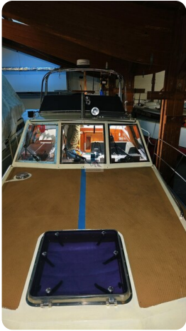
Reinke Tourina 10m_88