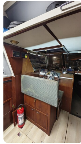
Reinke Tourina 10m_37