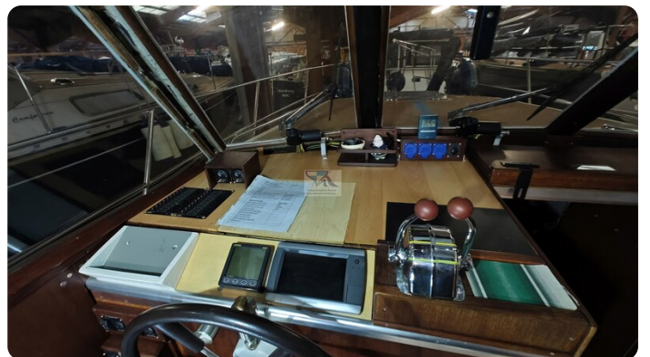
Reinke Tourina 10m_41