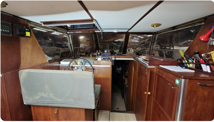
Reinke Tourina 10m_35