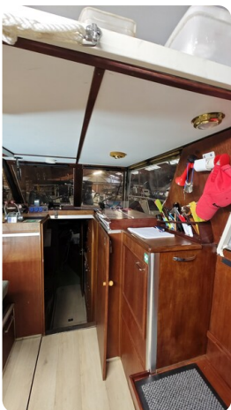
Reinke Tourina 10m_38