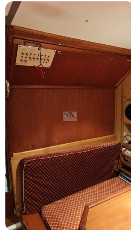
Reinke Tourina 10m_19