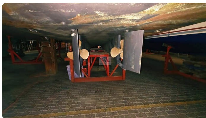
Reinke Tourina 10m_97