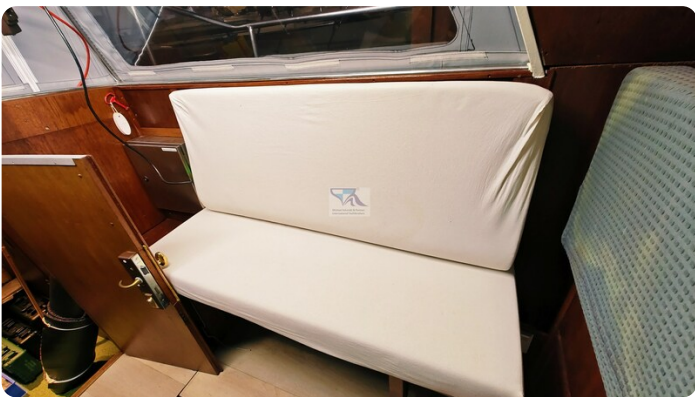
Reinke Tourina 10m_64