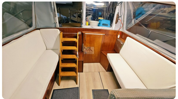
Reinke Tourina 10m_68