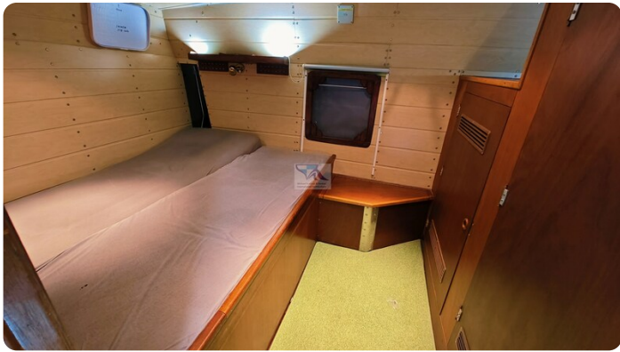
Reinke Tourina 10m_75