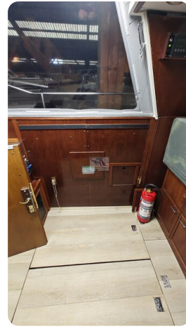
Reinke Tourina 10m_47