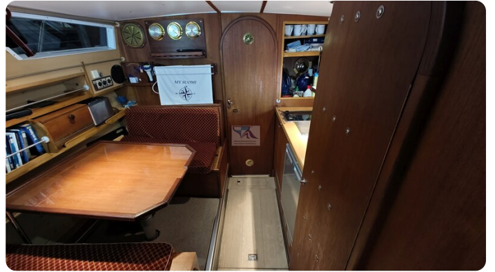
Reinke Tourina 10m_34