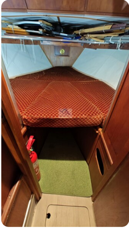
Reinke Tourina 10m_5