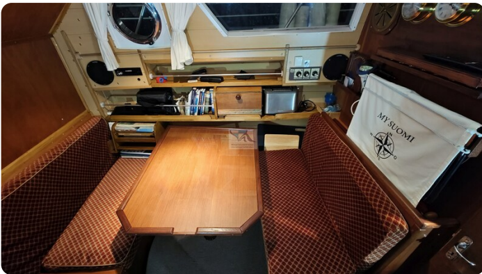
Reinke Tourina 10m_12