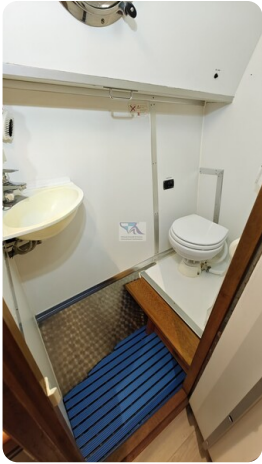
Reinke Tourina 10m_28