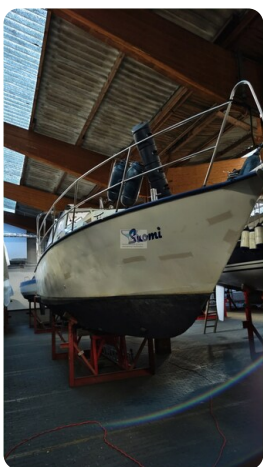
Reinke Tourina 10m_104