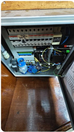
Reinke Tourina 10m_50