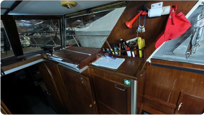
Reinke Tourina 10m_46