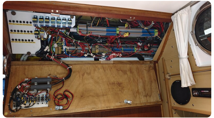
Reinke Tourina 10m_20