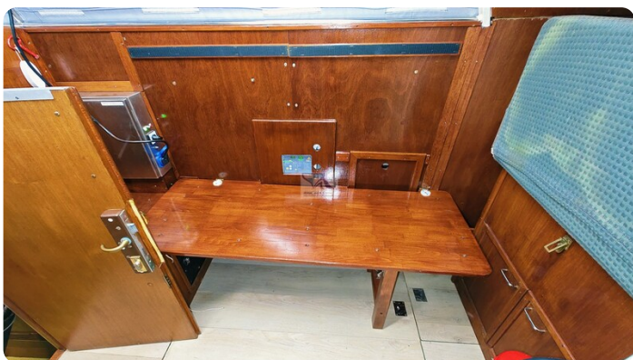
Reinke Tourina 10m_62