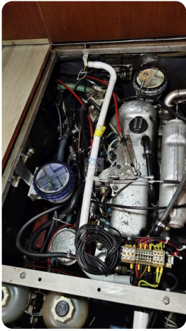
Reinke Tourina 10m_51