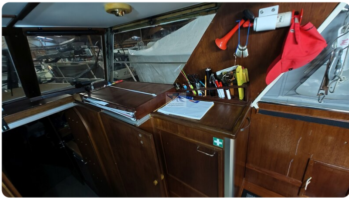
Reinke Tourina 10m_46