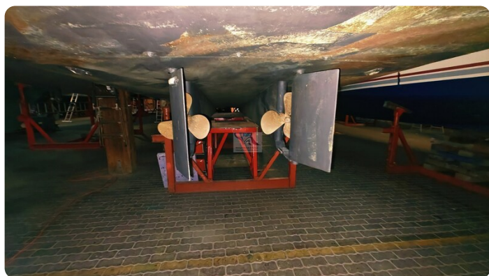
Reinke Tourina 10m_97