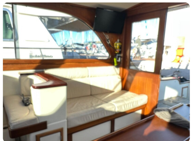
Liberty 35 salon detail