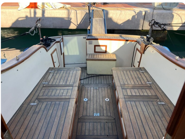
Liberty 35 cockpit view