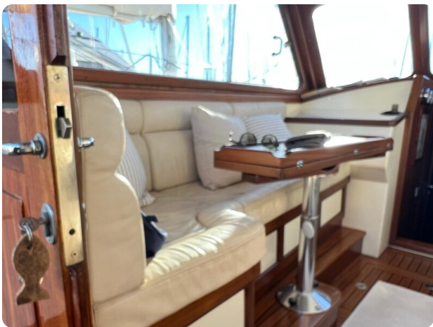
Liberty 35 dinette