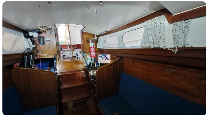
Marken II_msp797539 89