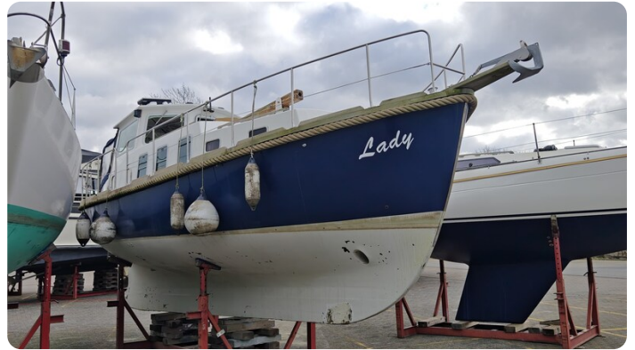
Spitzgatt Kutter LADY 2