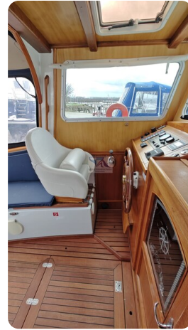
Spitzgatt Kutter LADY 35