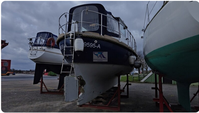
Spitzgatt Kutter LADY 1