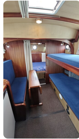
Spitzgatt Kutter LADY 70