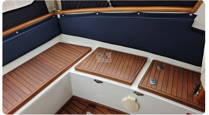
Spitzgatt Kutter LADY 56