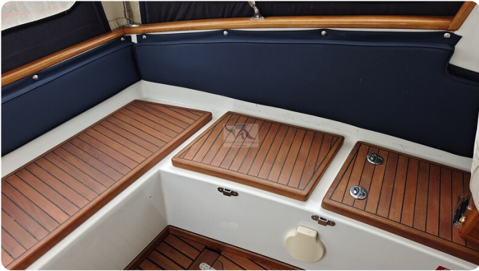
Spitzgatt Kutter LADY 56