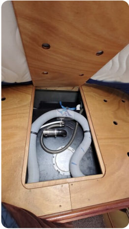
Spitzgatt Kutter LADY 94