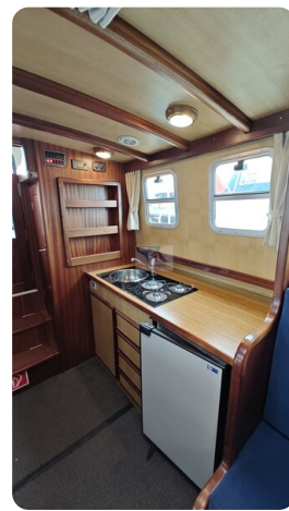
Spitzgatt Kutter LADY 74