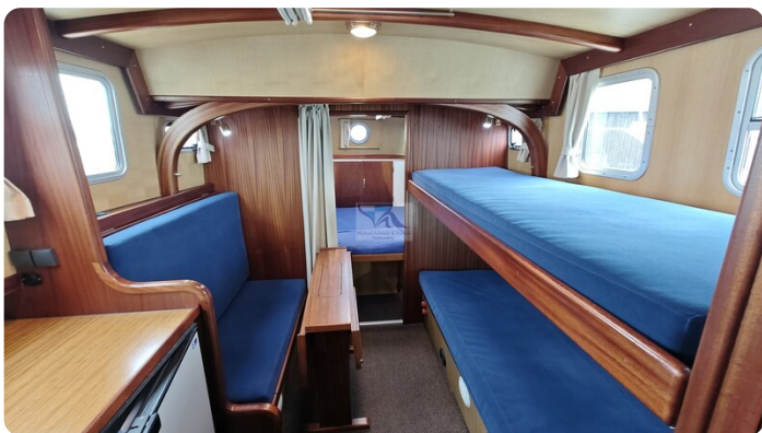
Spitzgatt Kutter LADY 78