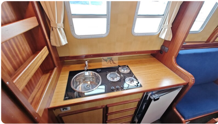
Spitzgatt Kutter LADY 72