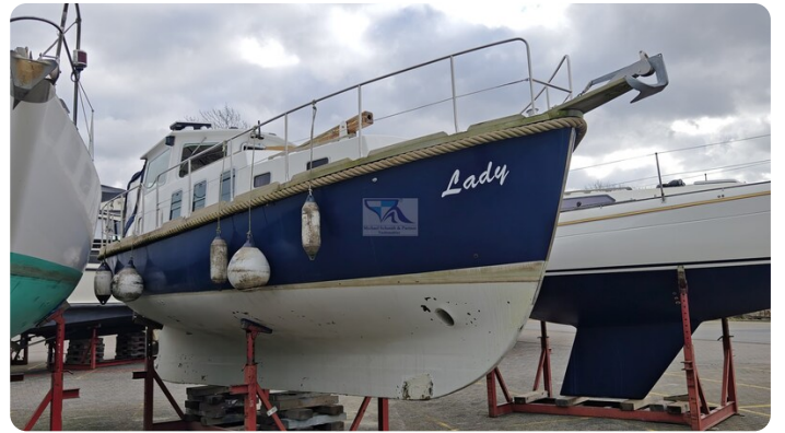
Spitzgatt Kutter LADY 7