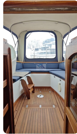
Spitzgatt Kutter LADY 61