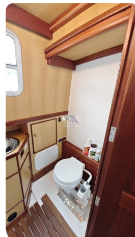
Spitzgatt Kutter LADY 66