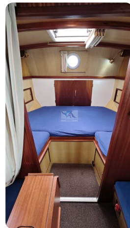
Spitzgatt Kutter LADY 84