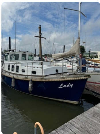
Spitzgatt Kutter Lady