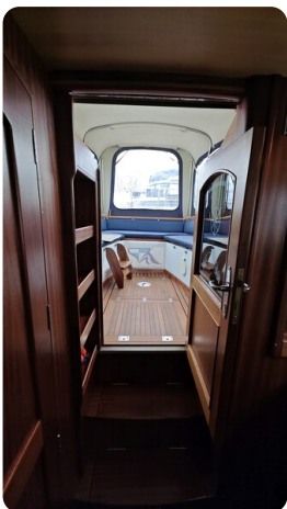
Spitzgatt Kutter LADY 63