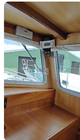
Spitzgatt Kutter LADY 30