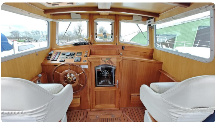
Spitzgatt Kutter LADY 28