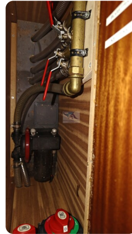
Spitzgatt Kutter LADY 59