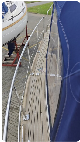
Spitzgatt Kutter LADY 9