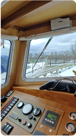
Spitzgatt Kutter LADY 32