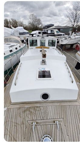
Spitzgatt Kutter LADY 18