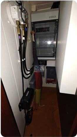
Spitzgatt Kutter LADY 58