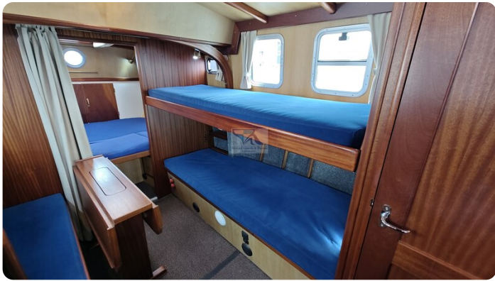
Spitzgatt Kutter LADY 67