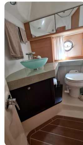
Cranchi 43 Mediterranée, bathroom.jpg