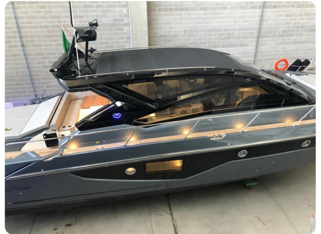
Cranchi 60 ST Hard Top View.jpg