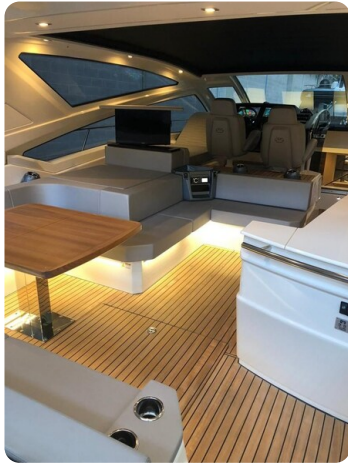
Cranchi 60 ST Cockpit.jpg